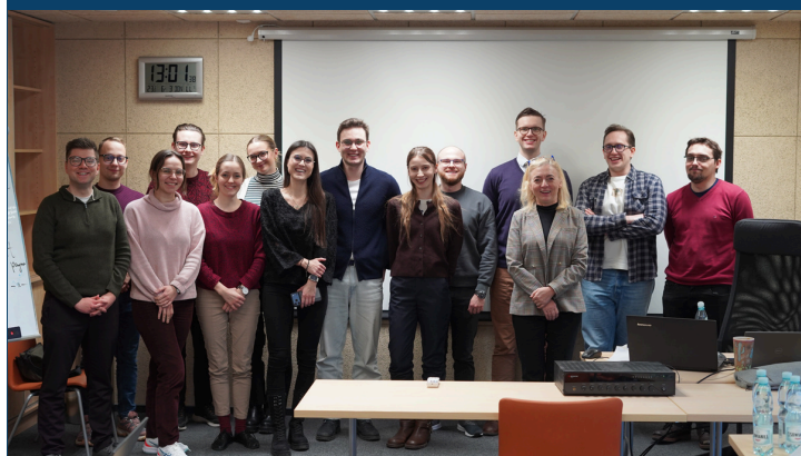
uczestnicy Konkursu THEMIS 2026 podczas części wstępnej Kursu przygotowującego w Krakowie, 8 stycznia 2026 r.

W związku z tym, że konkurs THEMIS prowadzony jest w całości w języku angielskim, jak również mając na uwadze specyfikę prawniczej odmiany tego języka wymagającą znajomości i umiejętności prawidłowego użycia specjalistycznego słownictwa, Dział Współpracy Międzynarodowej po raz drugi w historii organizuje specjalny kurs prawniczego języka angielskiego przygotowujący uczestników do tego konkursu. Kurs w 2026 roku składa się z dwóch części stacjonarnych: wstępnej i podsumowującej i części online, odbywającej się raz w tygodniu przez 12 tygodni. Łącznie kurs składa się z 48 godzin zajęć. Ma on na celu nie tylko podniesienie poziomu językowego biorących w nim udział aplikantów, ale także integrację poszczególnych zespołów i zwiększenie ich zdolności komunikacyjnych. Chcemy, by tego rodzaju wsparcie dla osób reprezentujących Krajową Szkołę miało charakter stały.