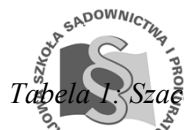
Tabela 1. Szacowana liczba osób oraz usług

Szczegółowe informacje dotyczące terminu i przedmiotu zamówienia zawiera tabela nr 1.